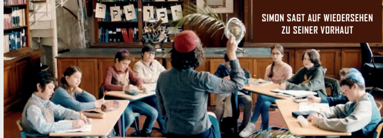
SIMON SAGT AUF WIEDERSEHEN ZU SEINER VORHAUT