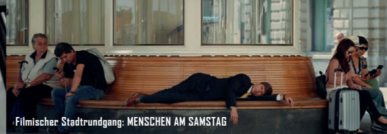
Filmischer Stadtrundgang: MENSCHEN AM SAMSTAG