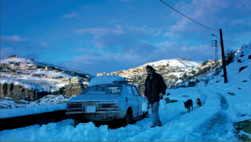
Zum Jahrestag des Libanonkriegs 1982 zeigt die Linse bis August sechs Filme.